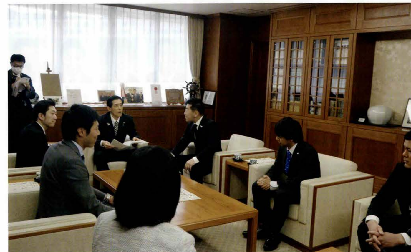
令和2年3月30日(月) 市長への政策提言書 手交式