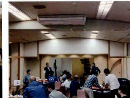
令和元年10月26日(土) 奈良YEGとの交流会