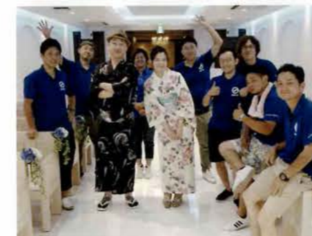
令和元年7月28日(日) 婚活事業「恋するマーメイド」